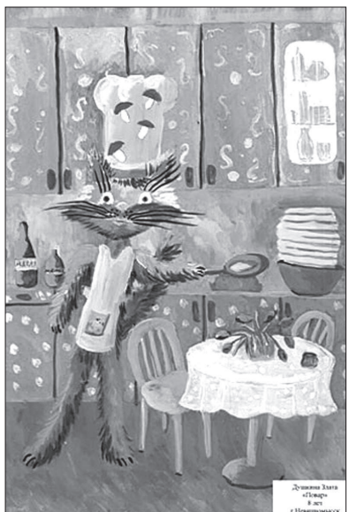
Так, по мнению Жюльетты, выглядят обитатели города Кэцбург.

В творческом состязании приняли участие более 800 юных живописцев со всей России. Компетентное жюри в итоге выбрало десять лучших работ. В их числе рисунок второклассницы