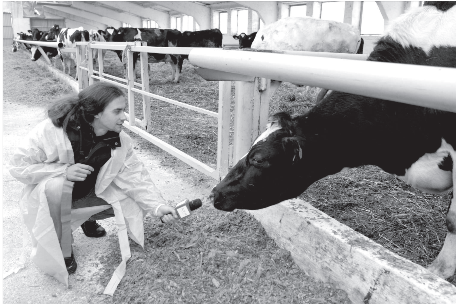
• Отвечая на вопросы журналистов, субъекты господдержки демонстрируют высокую степень заинтересованности и открытости.

В этом году на реализацию программ, направленных на поддержку фермеров, предусмотрено 693 млн руб