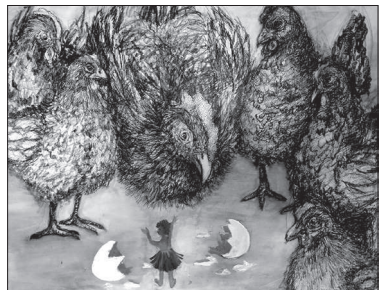
Рис. Арины Троицкой