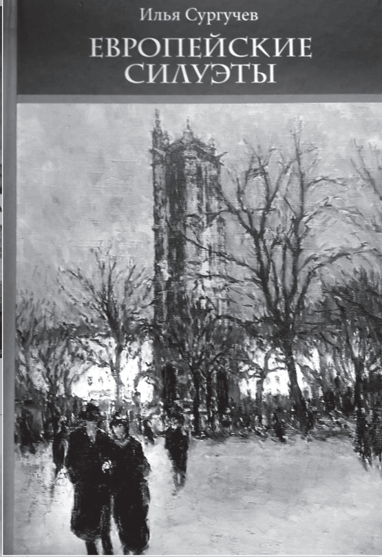
• В оформлении обложки использована картина П. Нилуса «Париж. Башня св. Жака». 1928 г.