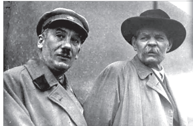
• М. Горький и Г. Ягода. 1935 г.

И всюду так, и всегда, начиная с монгольского ига, Россия кого-то спасала, устраивая чужое довольство и счастье.