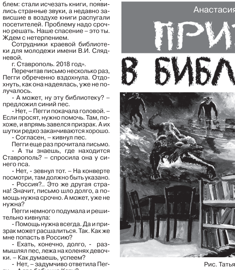
Рис. Татьяны Петровой

...Запив таблетки водой, друзья прислушались к своим ощущениям. «Ничего. А-а-а-а!» Девочка с синим псом уже стояла посреди оживленной улицы. Кругом суета: люди торопились по своим делам, машины снова туда-сюда. - Неужели сработало? - с сарказмом спросил пес. - Мы уже в Ставрополе? - Не знаю. Надо спросить, - девочка обратилась к одному из прохожих. - Добрый день, а скажите, пожалуйста: где находится краевая юношеская библиотека? - Идите прямо по улице. С левой стороны будет здание с синими