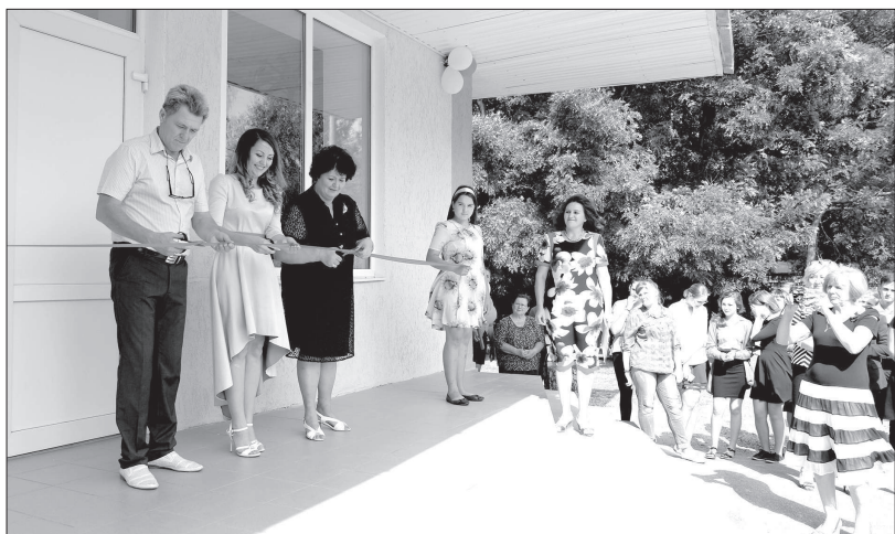
Открытие после ремонта Дома культуры в селе Новая Деревня Кочубеевского района.

«Сегодня деятельные, неравнодушные граждане, социально ориентированные НКО активно участвуют в реализации важнейших задач. Именно вовлеченность людей в дела страны и гражданская активность... делают нас единым народом, способным к достижению больших целей».