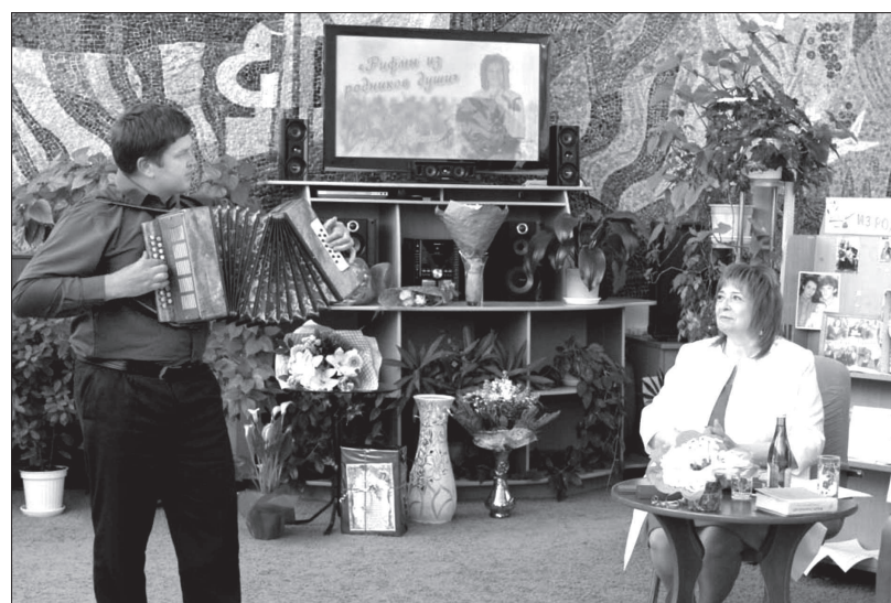
• Песня для поэта.