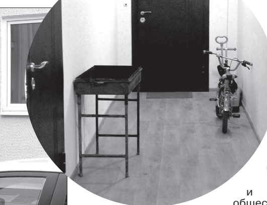
• В общем коридоре можно хранить не только велосипеды, но и мангал.

Уже в этом году сюда будет ходить автобус. А от остановочных платформ мы проложим к домам широкий тротуар. Также в планах на нынешний год строительство в микрорайоне детской площадки, ограждения со стороны скального обрыва ущелья и парковок для личного автотранспорта вдоль него, монтаж наружного освещения. А недавние сильные дожди выявили недостатки в системе ливневой канализации. В ближайшее время устранят. До детсадовской группы и начальной школы, которые базируются в Центре образования на улице Крылова, вполне можно дотопать пешком. Да и рейсовый автобус туда заезжает. Помещение под аптеку и медпункт предприниматель в микрорайоне уже выкупил. Словом, уже до конца нынешнего года в микрорайоне будет поч-