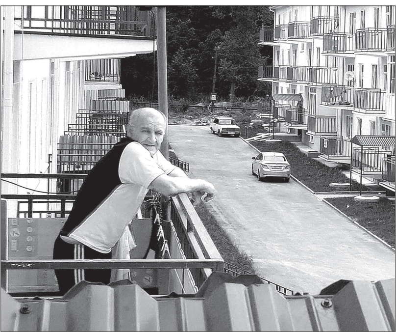
• А этот новосел доволен и окружающим пейзажем, и планировкой своего жилья.