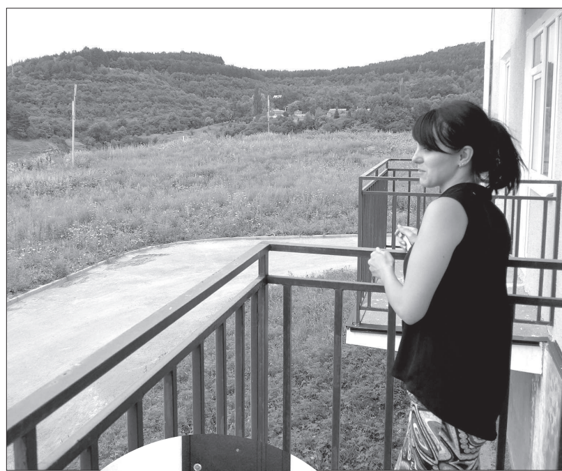
• С балкона новостройки на улице Катыхина открывается прекрасный вид на горные хребты.