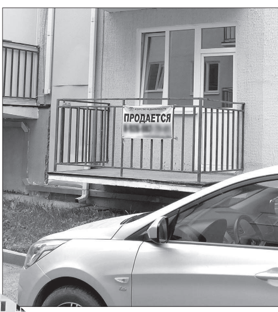
• Пока одни новоселы обустривают жилье, другие стремятся побыстрее его сбыть.

Дорогу к микрорайону еще в прошлом году заасфальтировали и пустили по ней рейсовый автобус. Сейчас его конечная остановка у первых жилых секций. От нее до самых удаленных домов метров 200 – 300. Но большую часть приходится идти в гору. Для пожилых переселенцев это тяжело. Власти намерены в ближайшее время устранить это упущение. Начальнику управления городского хозяйства показывает на автодороге у дальнего конца микрорайона два уже готовых «кармана» под оставшиеся платформы рейсового автобуса и чуть дальше – место, где будет разворотный круг.