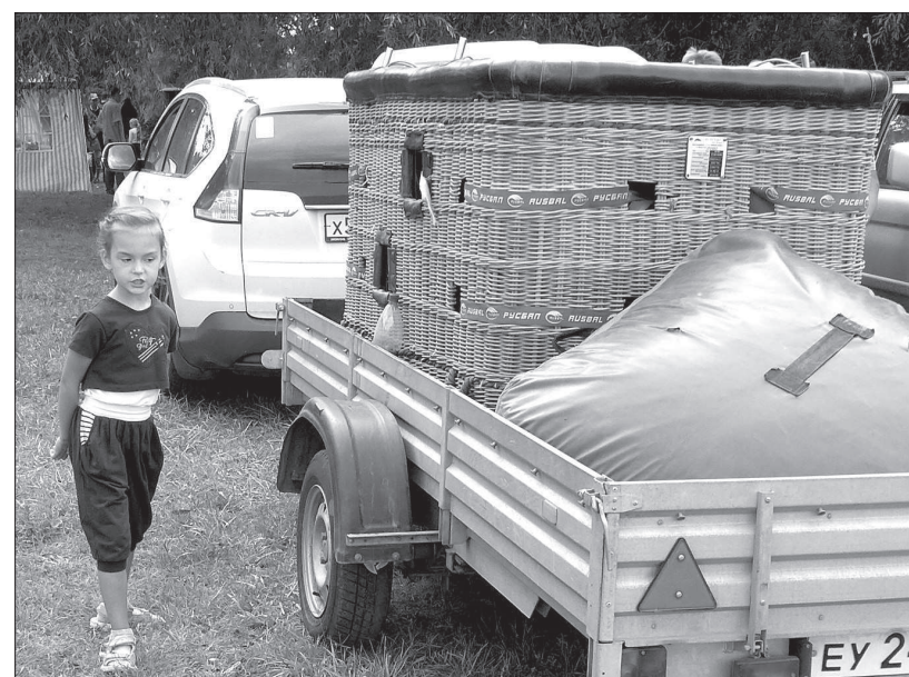
• К старту готовы.

Спортивный уровень здесь достаточно высокий, а рейтинг кавминводского фестиваля практиче-