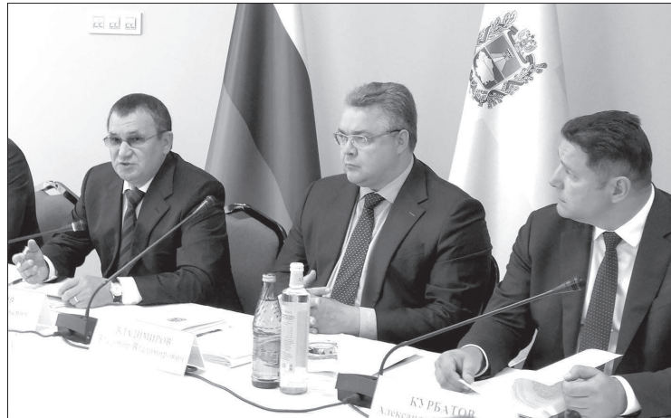
Заседание рабочей группы ведет первый заместитель председателя Совета Федерации Николай Фёдоров (слева).

На днях прошло выездное заседание рабочей группы Совета Федерации РФ по взаимодействию с федеральными органами исполнительной власти и правительством Ставропольского края по вопросам комплексного развития города-курорта Кисловодска.