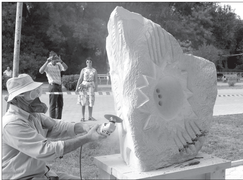
• Скульптуры из песчаника украшают обновленные скверы и парки Невинномысска.

Около месяца в самом центре Невинномысска, рядом с главным городским фонтаном, работает своеобразный арт-городок. Он состоит из скульптур, созданных мастерами в ходе недавно прошедшего фестиваля искусств «Слияние».