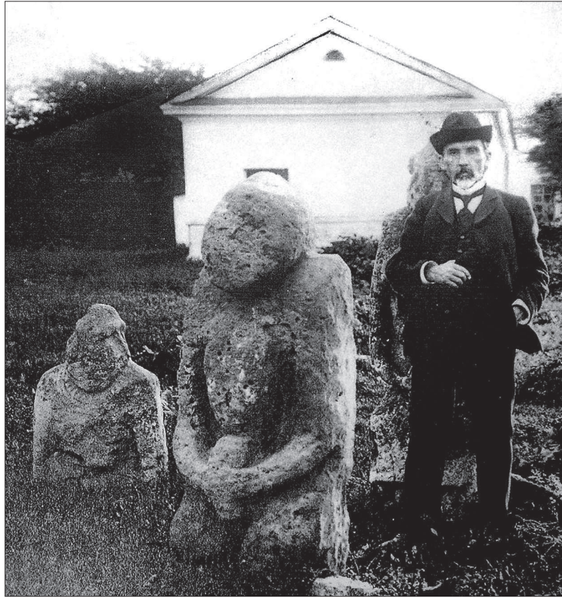
• Г.Н. Прозрителев, дореволюционное фото.

И ведь действительно по указанию старика археологи обнаружили в тех местах хотя и не «золотого всадника на коне с серебряной сбруей», но зато следы древнего городища с курганами. Не рождаются легенды на пустом месте! Кто-то и вправду находил