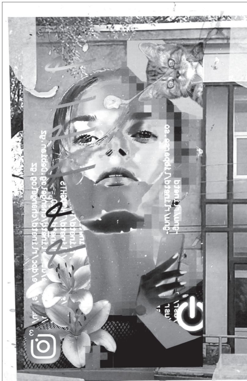
• Оригинальные граффити создают новый облик города химиков.

Что касается другого наследия «Слияния» - граффити-композиций, то они, конечно же, сразу нашли своего постоянного «прописку». Преобрази-