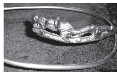
• Копии знаменитых вещей из Ставропольского клада 1911 года (сейчас в Эрмитаже).

сая близ ставропольского Иоанно-Мариинского монастыря, Прозрителев не преминул вспомнить старинную легенду о разбойничьем клада, будто бы здесь спрятанном: «В балке этой в 1858 году была открыта пещера, вырытая под большим ветвистым дубом, вход в которую был завален камнем и засыпан землей».