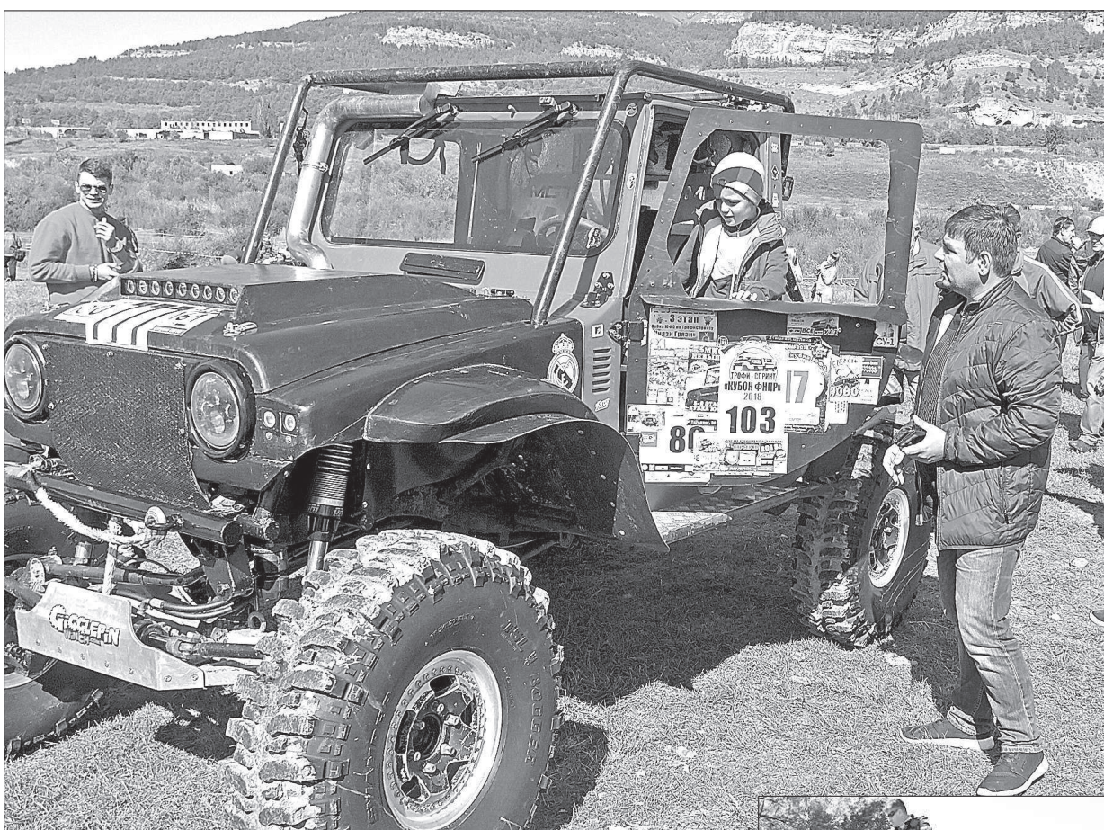
Такие автомобили удивляют и детей, и взрослых.