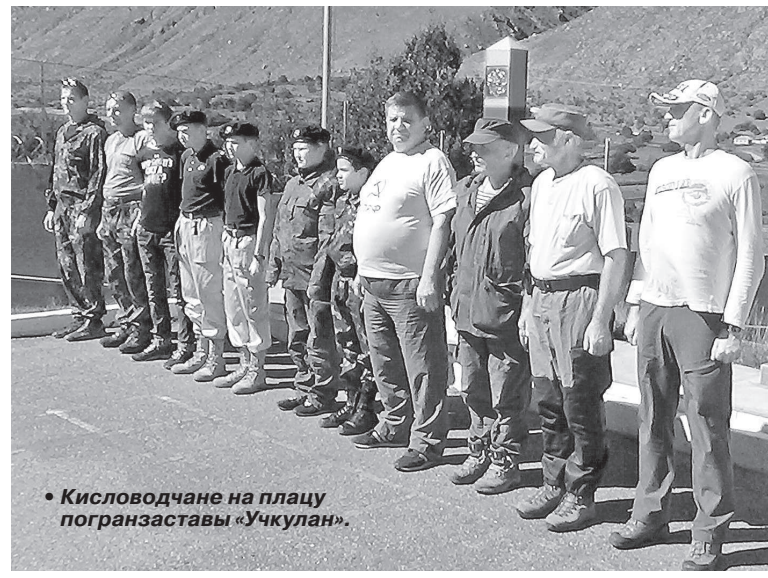
• Кисловодчане на плацу погранзаставы «Учкулан».