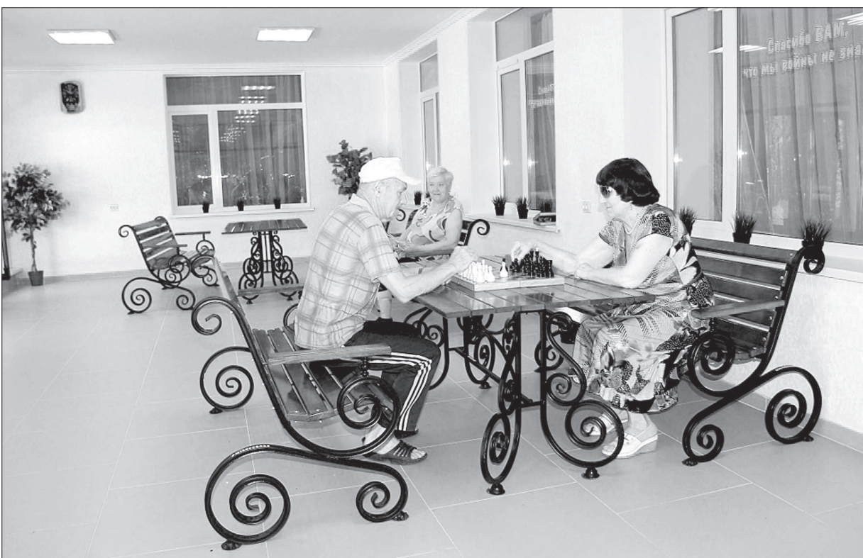
• Так стильно выглядит после ремонта веранда у центрального входа в СКГЦ.

Каждый год приоритеты расходов бюджета края остаются неизменными: большая его часть уходит на социальную поддержку ставропольчан. И мы вполне можем узнать, куда именно. Один из адресов социальной поддержки - Ставропольский краевой геронтологический центр.