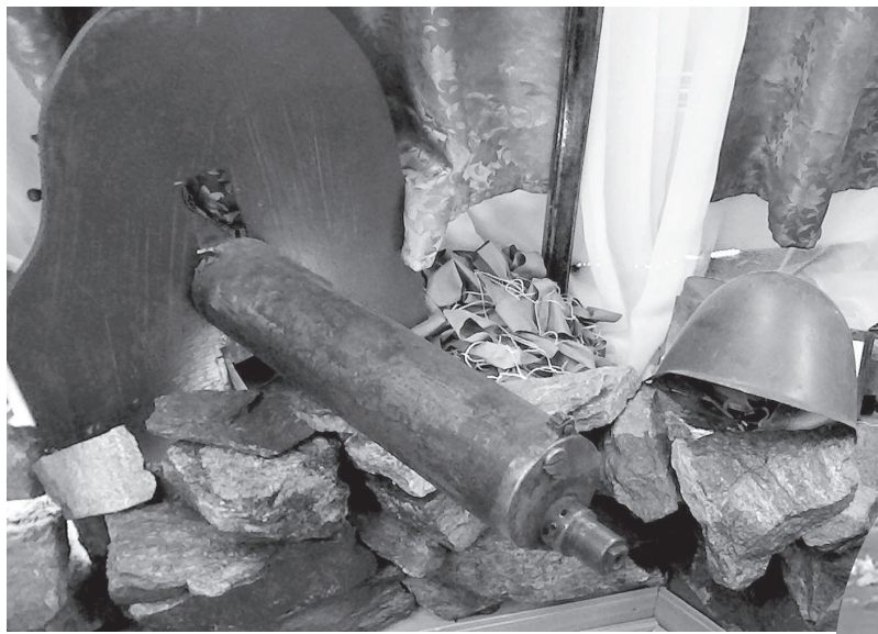
• За 75 лет пребывания в ледниковом озере пулемет максим отлично сохранился.