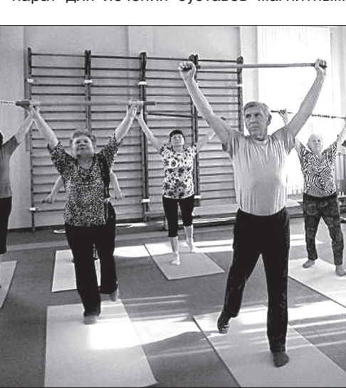
• Занятия лечебной физкультурой.

И уж, конечно, медобслуживание поставлено на высшем уровне. Есть такое же оборудование, что и в коммерчески здравницах. И даже сверх того. Недавно, например, приобрели замечательный аппарат для лечения суставов магнитным