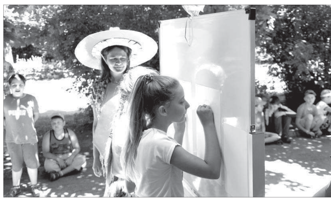
Библиотекари Невинномыска не замыкаются в четырех стенах. Летом, к примеру, для детей организуют интересные выставки и праздники.

вой комнаты для ребят, оснащенной игрушками, горками и сухим бассейном. Здесь же родители хотели бы обме-