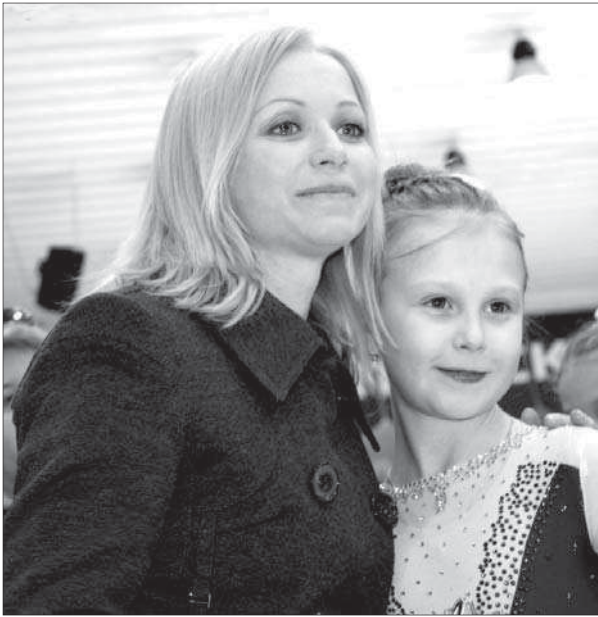
Юные фигуристы Ставрополя с нетерпением ждут очередей встречи с Еленой Бережной.