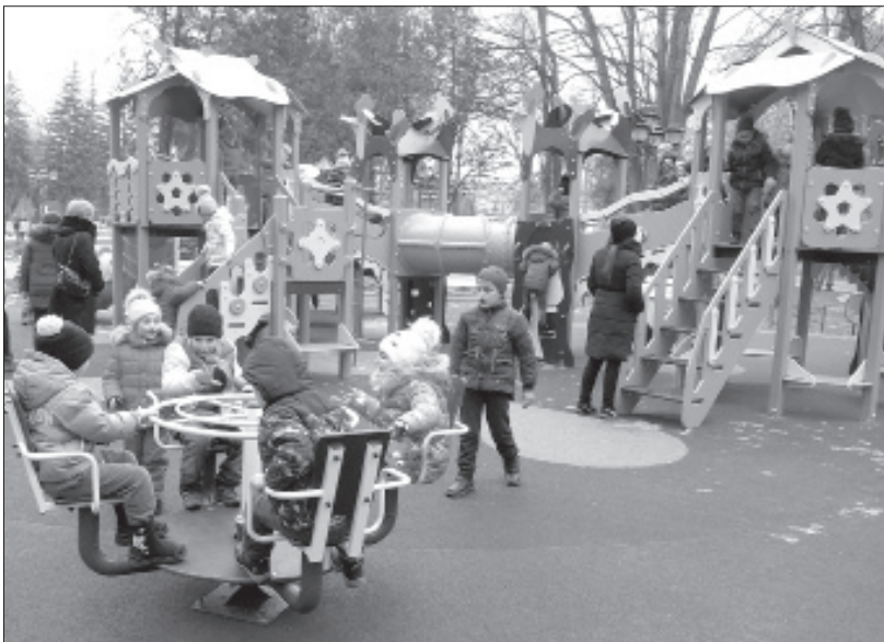
● На детской площадке есть все для веселого отдыха.