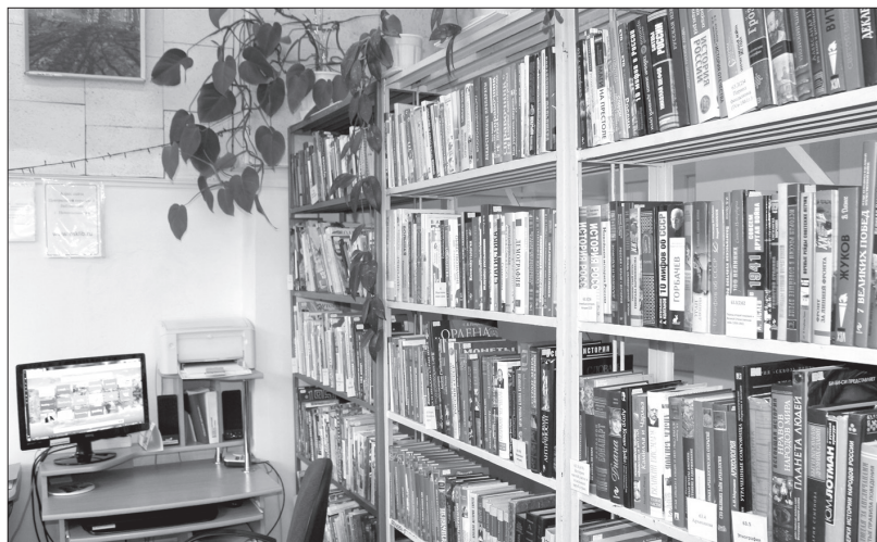
Сегодня в фондах филиала № 4 хранится около 30 тысяч изданий.

начинают понемногу читать, брать книги на дом. Кстати, Семён впервые переступил порог библиотеки в четыре года.