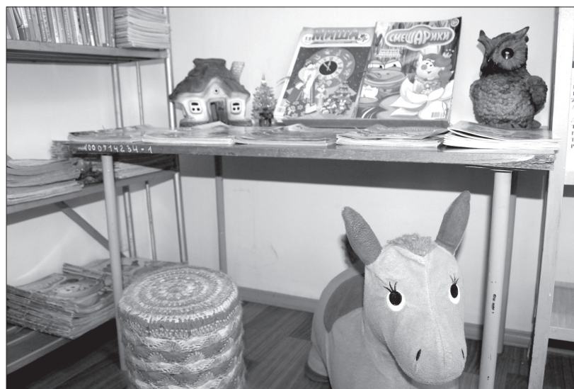
Для самых маленьких читателей в библиотеке оборудовали волшебный уголок.