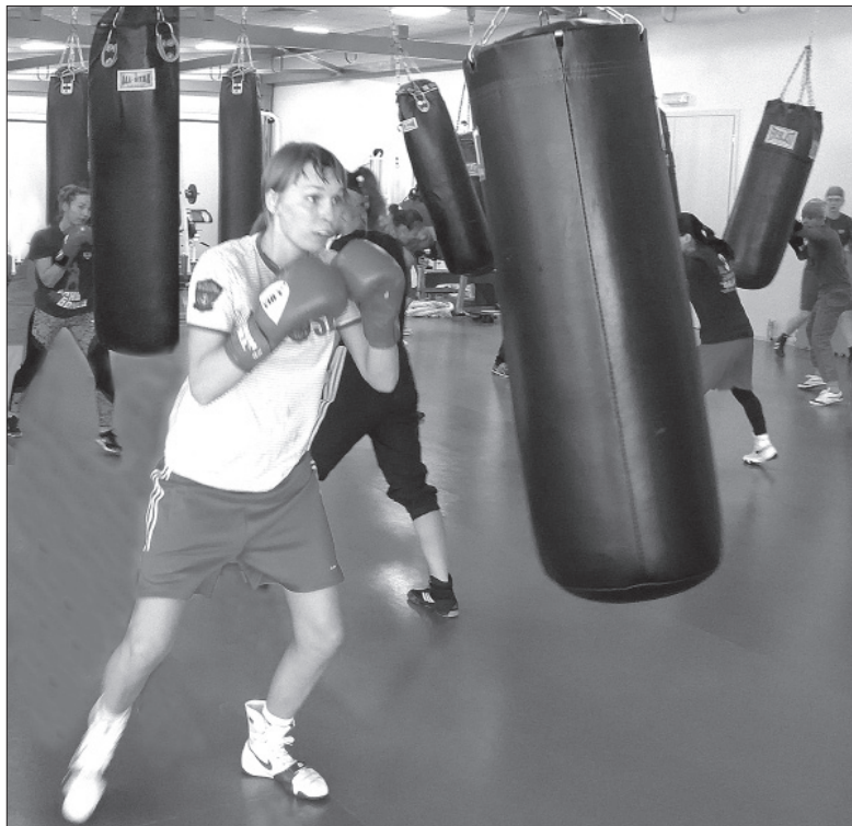
● Женская сборная России по боксу готовится к соревнованиям.

ВОСЕМЬ лет назад оба спортивных комплекса из ведения ЦСКА перешли в подчинение Министерства спорта РФ. И тогда же, в преддверии Олимпиады в Лондоне, здесь началась грандиозная реконструкция. Сегодня, как мы убедились вчужую, спортивные залы и кабинеты восстановительной медицины на Верхней базе оснащены лучшим оборудованием и не имеют аналогов в России. А