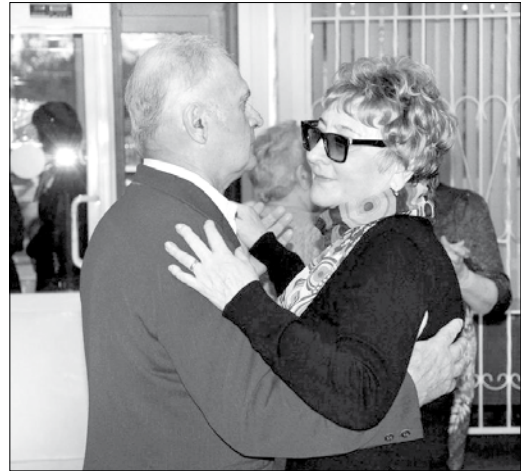
А. ИВАНОВ.

Что касается танцевальных направлений, то наиболее популярной популярностью пользуется вальс. Впрочем, некоторые невинномысцы «третьего возраста» демонстрируют даже весьма экзотическое для наших широт танго. Стоит отметить, что любой танец дает заряд положительных эмоций, действует все основные мышцы, что снижает риск развития различных недугов. Это подтверждают многие участники танцевального объединения. В последнее время клуб «Танцующий человек счастлив» работает в культурно-досуговом центре «Родина». Здесь, как сообщили в администрации Невинномыска, вскоре пройдет основательный ремонт.