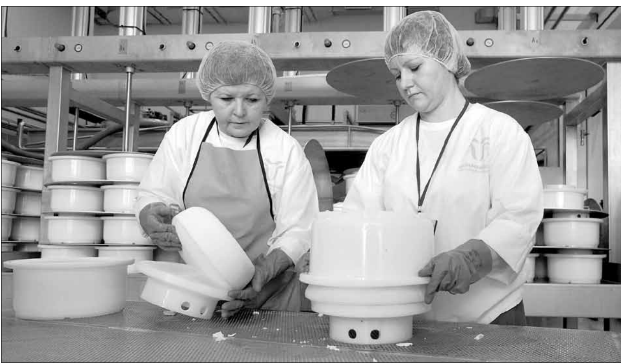
В ООО «Казьминский молочный комбинат» осваивают новые технологии выпуска продукции.