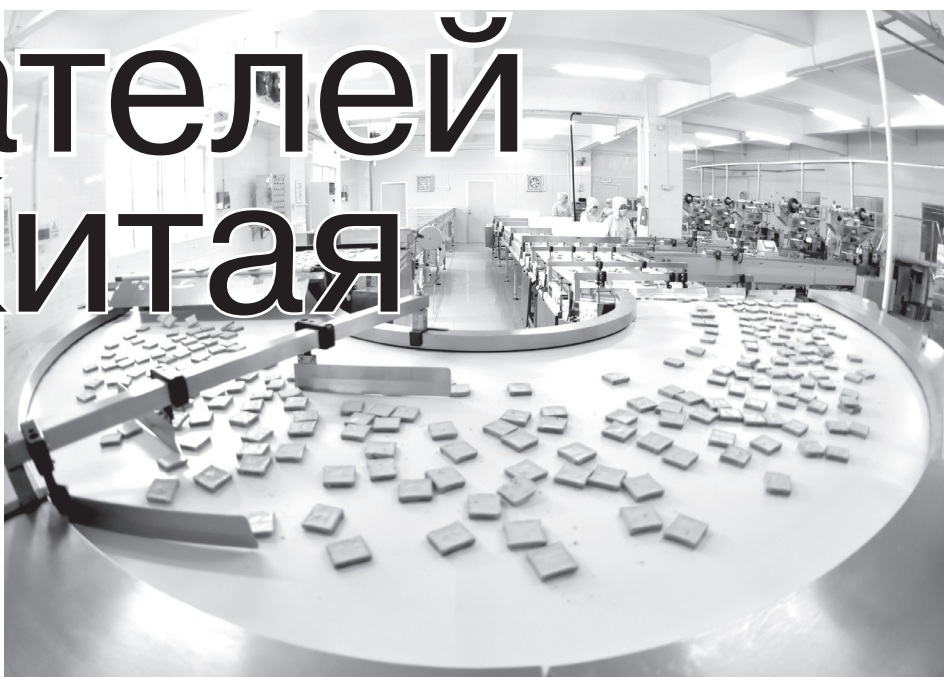
• Обработываемые продукты питания на автоматическом конвейере на заводе компании Rapra Foods.

В 2017 году с замедлением до отметки 9,3% завершился двузначный рост ВРП Чунцина, который фиксировался на протяжении 15 лет. В прошлом году данный