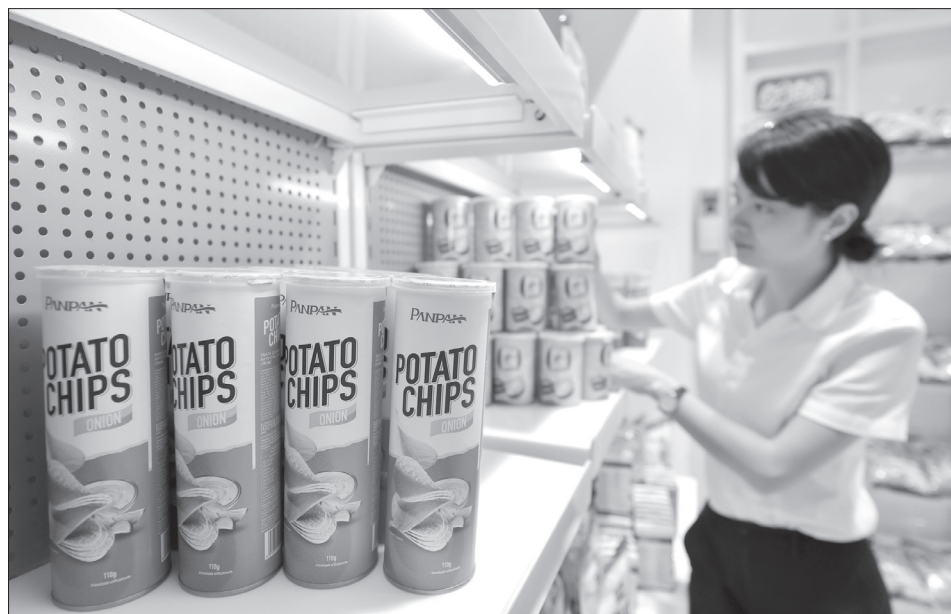
• Сотрудница компании Rapra Foods проверяет упаковки с картофельными чипсами и другими закусками, предназначенными для зарубежных рынков.

Компания Shanxi Uni-moon Green Paper уже пожинает плоды от перехода к чистой энергии. Эта дочерняя компания одного из угольных предприятий провинции Шаньси разработала технологию произ-