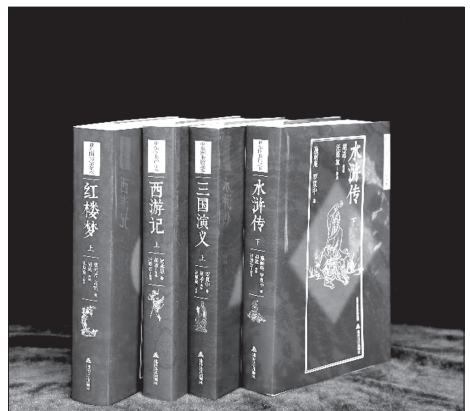
• Четыре классических произведения китайской литературы, напечатанные на «каменной бумаге», изготовленной из пуха породе, отходов угольного производства (фото предоставлено компанией Shanxi Uni-moon Green Paper).

водства бумаги из пустой породы, отходов угольного производства. Она рассчитывает спасти 2,4 млн деревьев, производя 120 тыс. тонн такой «каменной бумаги» в год.