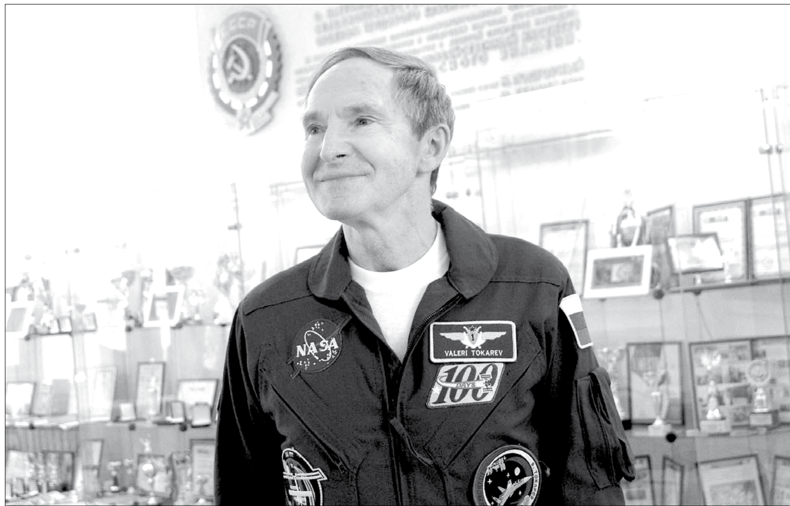
Герой России летчик-космонавт Валерий Токарев на встрече со студентами Ставропольского государственного аграрного университета.

Вчера на Ставрополье прибыл Герой России летчик-космонавт Валерий Токарев