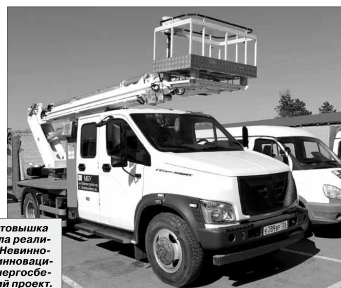
Новая автовышка позволила реализовать в Невинномыске инновационный энергоберегающий проект.

Коммунальный автопарк Невинномыска пополняется новой спецтехникой. Это стало возможным благодаря государственной программе Ставропольского края «Развитие жилищно-коммунального хозяйства, защита населения и территории от чрезвычайных ситуаций». Вопрос технического оснащения коммунальных служб региона, создания в городах и поселках комфортной среды находится на особом контроле у губернатора Владимира Владимировича.