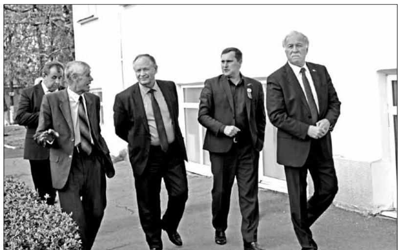
• Николаю Великдану (первый справа) устроили экскурсию по учебному заведению.

После этого состоялся круглый стол, в ходе которого были обсуждены проблемы кадрового обеспечения регионального агропрома. Обслуживание «умных» машин, которые сегодня активно внедряются в агропромышленное производство региона, требует высококвалифицированных кадров. И специализированные учебные заведения региона могут справиться с этой миссией, прозвучало на встрече. Будущие специалисты-агроинженеры интересовались у первого зампреда краевого правительства существующими мерами государственной поддержки отрасли, а также возможностью встать на ноги, открыть свое дело после окончания учебного заведения при поддержке краевого бюджета.