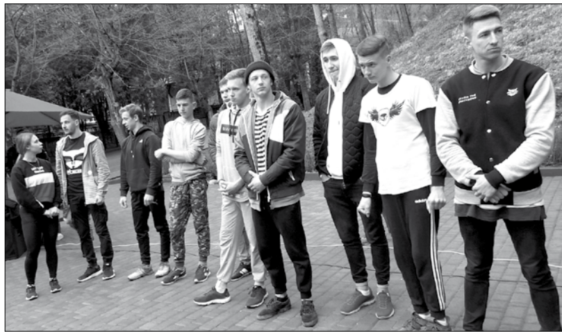
Воркаут-команда Offbeats в Национальном парке «Кисловодский».

впервые. Я знаю этих кисловодских ребят, они упорные. Так что непременно в ближайшее время освою то, что продемонстрировал гость из Ставрополя.