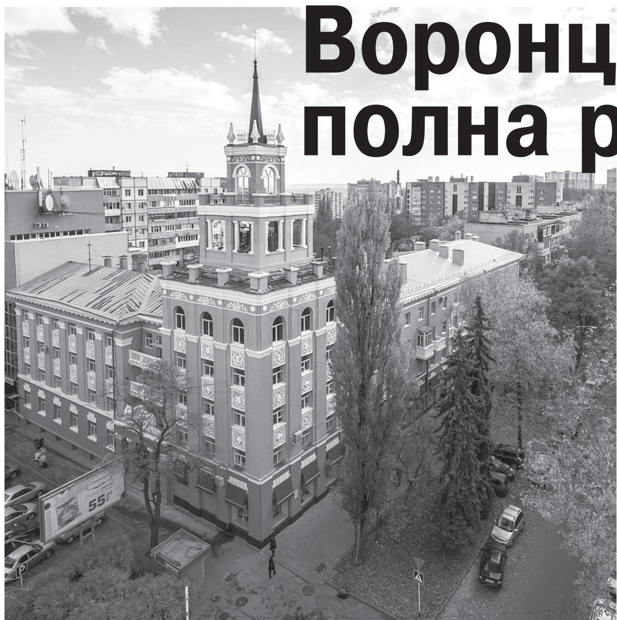
● Дом со шпилем.

СЕГОДНЯ наш маршрут по историческому Ставрополю - проспекту Октябрьской Революции. Сколько названий сменила эта улица? Острожная, Почтовая, Воронцовская, при советской власти пр. Пролетарский, им. Ворошилова. Самое памятное из них - в честь наместника Кавказа графа Михаила Семёновича Воронцова (1782 - 1856). Вопреки эгиптам А.С. Пушкина - «Полумилорд, полупуц, полумудрец, полуневежда...» - этот человек все же оставил и добрый след. Достаточно напомнить, что он участник Кавказской войны, герой Отечественной войны 1812 года. С 1823 года граф Воронцов - генерал-губернатор Новороссии и Бессарабии. В 1844 - 1854 годах - кавказский наместник. На Ставрополе положил начало разведению садов и парков, проведению обширных геологических исследований, строительству дорог.