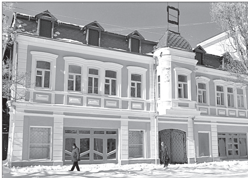
● Здание бывшего кинематографа «Солей».

На этой старинной улице прошли мои детство и юность. Как в песне: «В моей судьбе ты стала главной, родная улица моя...». А потом я узнала, какие здесь жили замечательные люди.