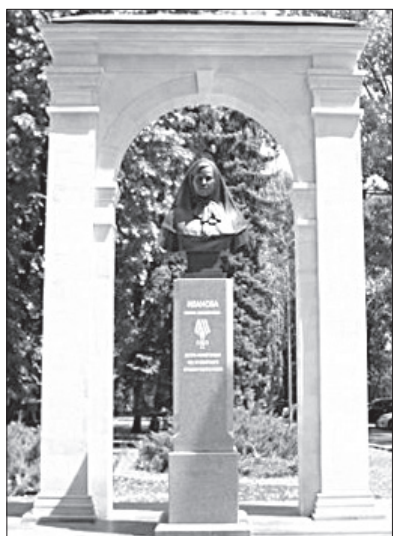
● Памятник Римме Ивановой.