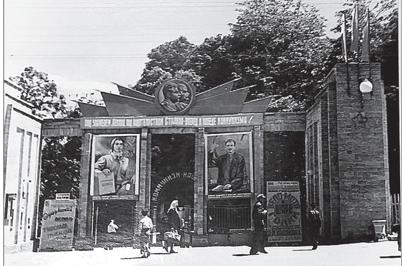
● Вход в Ставропольский городской парк. 1950-е годы.

Почему же здание называют домом полярного исследователя? Принадлежало оно известному врачу и путешественнику Павлу Григорьевичу Кушакову. Дворянин