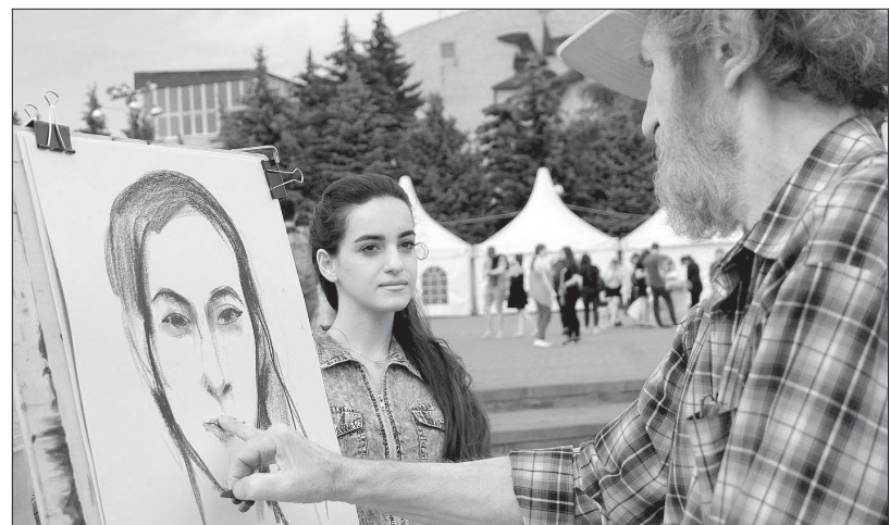
• Мастер-класс художников на Крепостной горе.