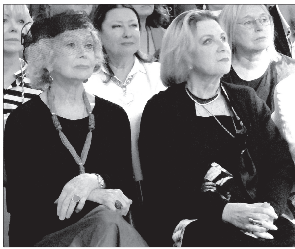
• На днях имена Светланы Немольяевой и Аллы Демидовой увековечат на Аллее звезд.