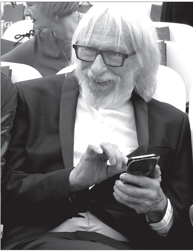
• Пьер Ришар сильно изменился, но улыбка та же, что и 40 лет назад.