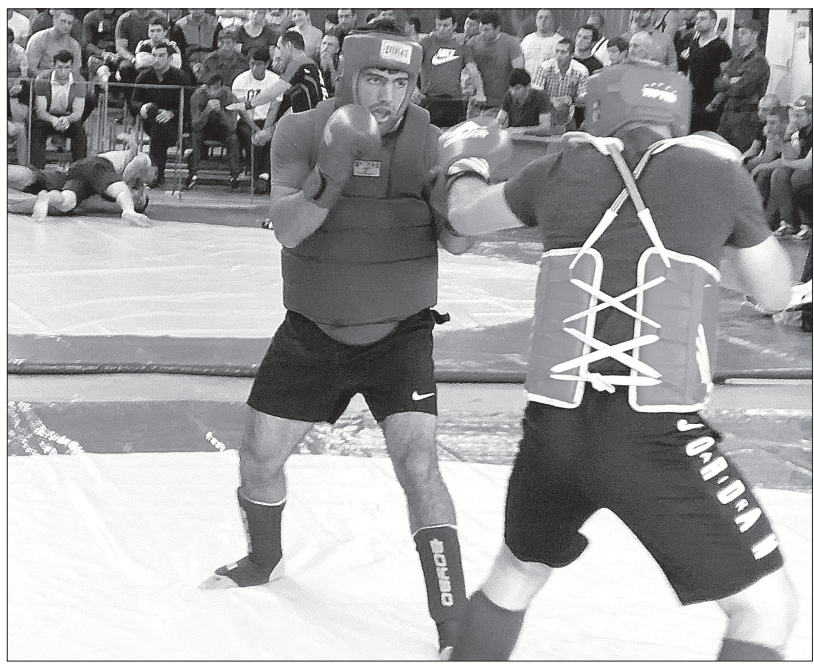
Бои с использованием ударной техники.