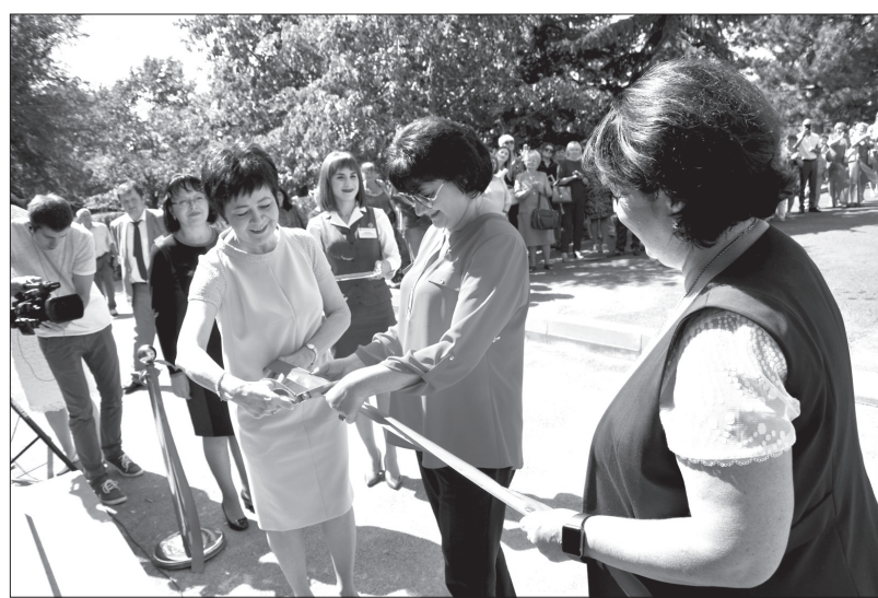
Дополнительный офис ПАО Ставропольпромстройбанк в Курсавке открыт по адресу: ул. Красная, 18.

На церемонии открытия неоднократно прозвучало, что столица Андроповского района отличается повышенной деловой активностью. И, как показали 18 лет работы банка на этой территории, ассортимент его предложений здесь крайне востребован. Клиентская база Ставропольпромстройбанка в районе уже превышает две тысячи организаций и физлиц. «Банк продолжает работу в формате классического офиса. И мы трепетно относимся к тому, чтобы посещение наших подразделений было всегда комфортным и продуктивным по каждому вопросу, с которым к нам обращаются, - отметили