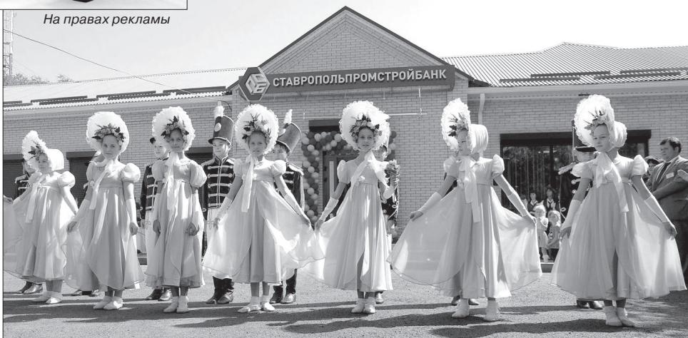
Торжественное открытие дополнительного офиса ПАО Ставропольпромстройбанк для жителей Курсавки сопровождалось настоящим праздником. Маленькие гости с азартом участвовали в организованном специально для них тематическом шоу. А программа для действующих и потенциальных клиентов банка включала зрелищные выступления творческих коллективов, фуршет и розыгрыши подарков.

ла И. Егорова. - В обновленном офисе, оформленном в строгом соответствии с требованиями корпоративного стиля, до мелочей продумано все: и зонирование пространства, и организация банковских процессов. Уверена, что уровень обслуживания обязательно оценят клиенты и что их у нас станет намного больше».