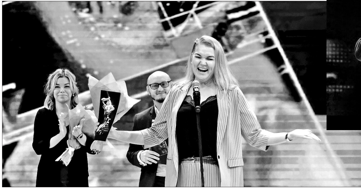
Телекомпания «СвоёТВ» стала финалистом «ТЭФИ-Регион» в Ставрополе с сериалом «Князь востока».

В Ставропольском Дворце культуры и спорта наградили финалистов XVIII Всероссийского телевизионного конкурса «ТЭФИ-Регион - 2019».