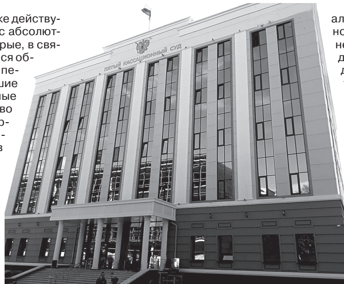
В этом здании будут выносить окончательные приговоры на уровне субъектов РФ, входящих в СКФО.

Пятый кассационный суд общей юрисдикции начал свою деятельность с 1 октября нынешнего года. То есть еще за три недели до тор-