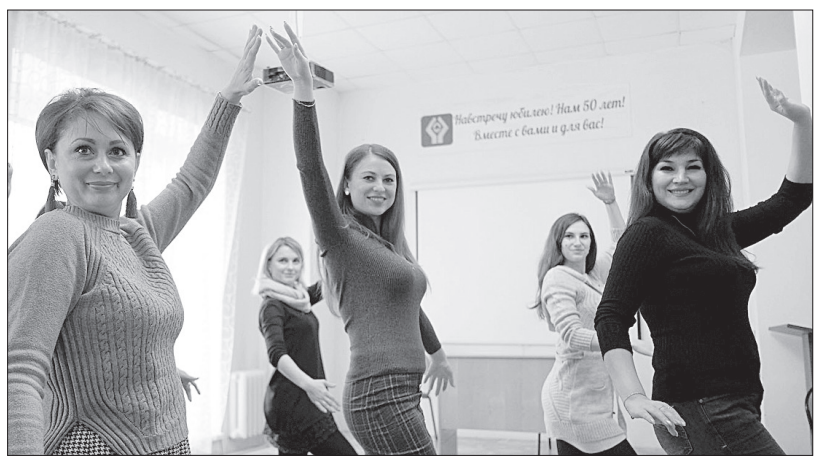
Работники домов культуры края на занятии по режиссуре массовых представлений.