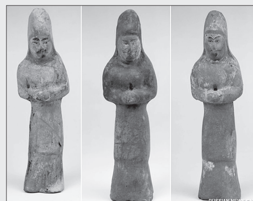
Три раскрашенные керамические фигуры, найденные в королевской гробнице в деревне Яньшунь.

Археологические раскопки проходили с августа по декабрь этого года. Из-под сооружения извлечено в общей сложности 120 памятников культуры, большинство из которых являются расписными погребальными статуэтками из керамики.