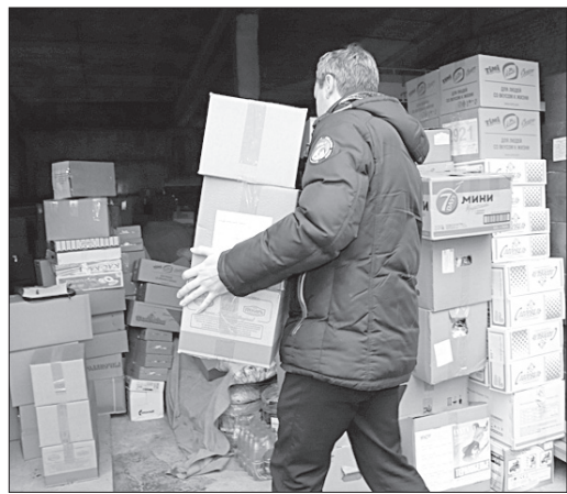
Новогодние подарки и продукты питания Ставрополье собирает в пятый раз. В течение нескольких дней их свозили на склад материально-технической базы ПАСС СК, рассказали в пресс-службе ведомства. Ко многим подаркам были приложены открытки и письма. По традиции активное участие в сборе сладостей приняли краевые министерства, администрация Кировского и Изобильненского городских округов, кондитерская фабрика «Шоколенд», Михайловский торговый комплекс, индивидуальные предприниматели и многие другие.

Четыре с половиной тонны гуманитарной помощи, собранной ставропольчанами для жителей Донецкой и Луганской народных республик, были отправлены из краевого центра в распределительный пункт сбора гуманитарной помощи в поселок Ковалевка Ростовской области, откуда они уедут по адресу.