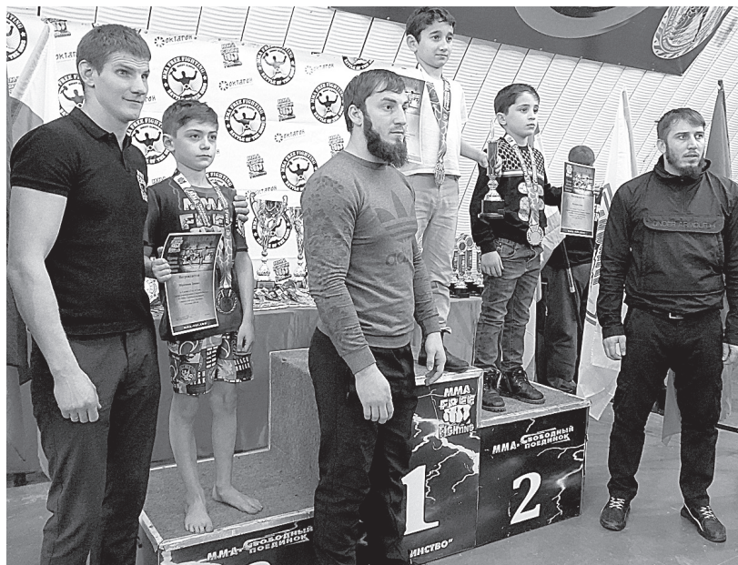
Тренеры со Ставрополя, из Дагестана и Чечни со своими юными воспитанниками.

Нынешний турнир в Кисловодске - первая проба сил перед от-