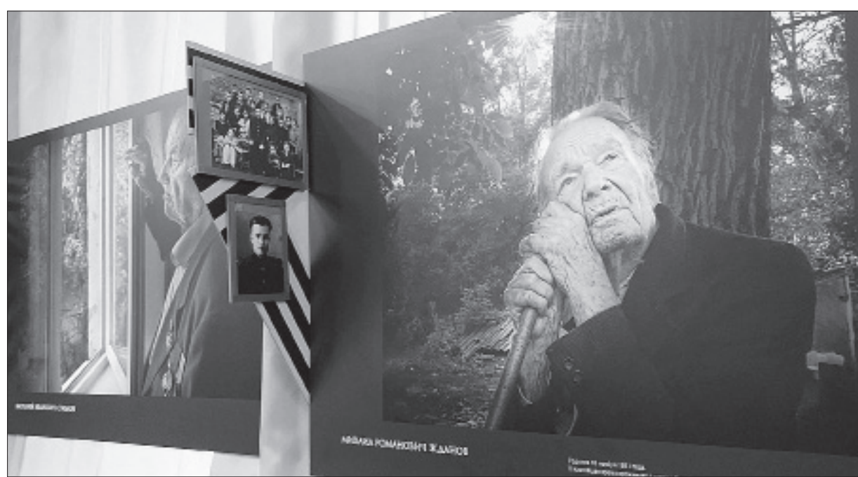
Автору снимков хотелось показать не просто ветеранов войны, а людей, проживших большую жизнь.