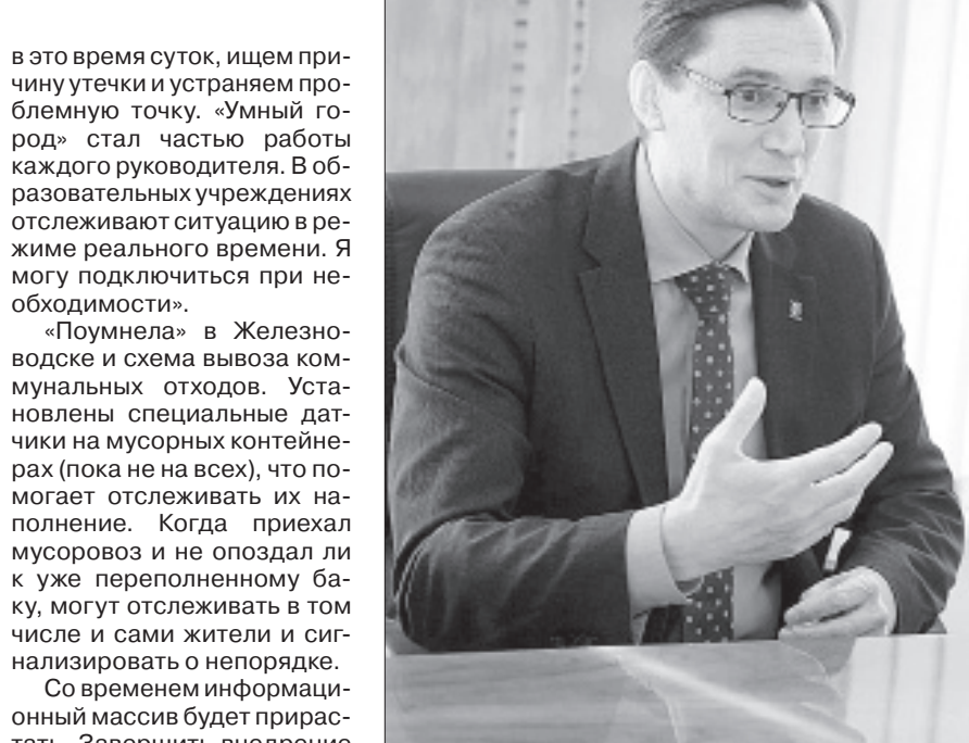
Глава Железноводска Евгений Моисеев рассказывает о возможностях проекта «Умный город».