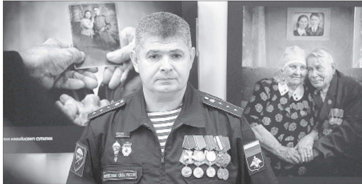
Фотохудожник Андрей Смольников: «Снимать ветеранов было непросто...»