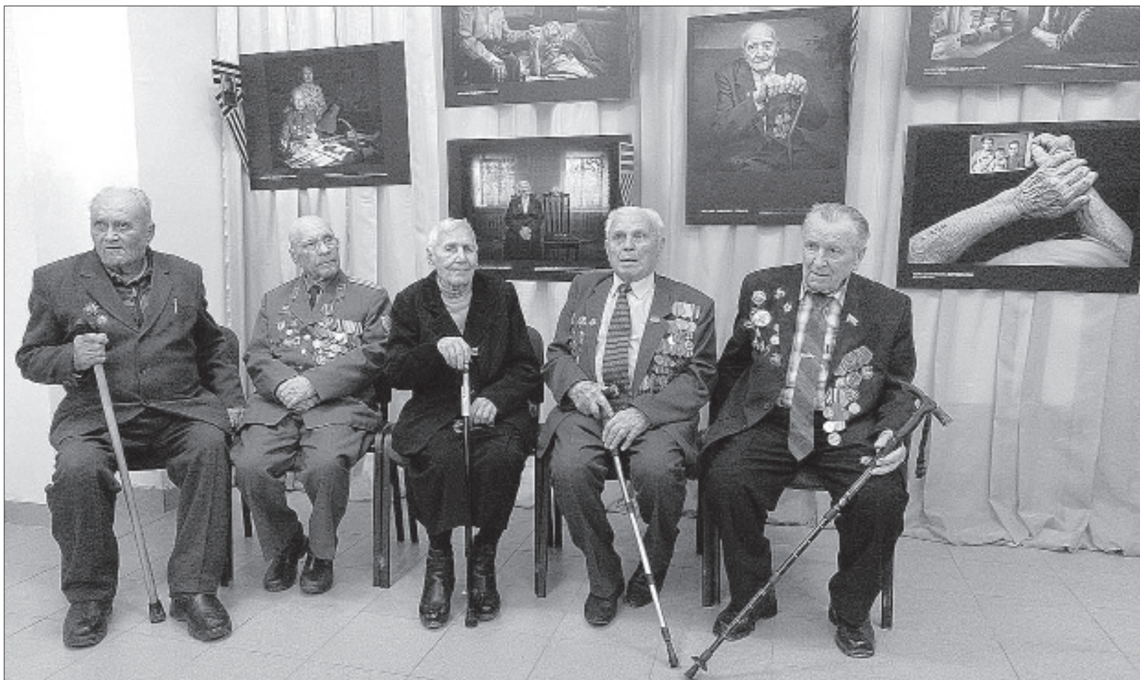
На открытие выставки из Изобильненского района приехали пять ветеранов.

ся в лица ветеранов, подумать... Тут не нужно много слов, ведь каждый кадр – пронзительное напоминание. И – целая судьба.