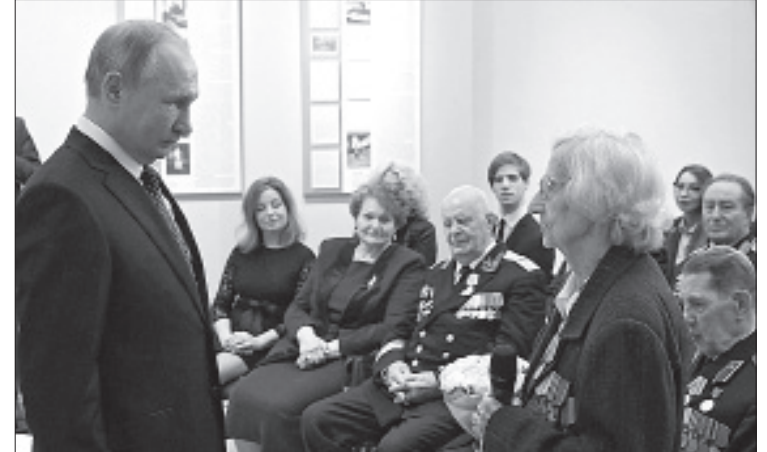
На церемонии вручения юбилейных медалей «75 лет Победы в Великой Отечественной войне 1941-1945 годов».

Президент Владимир Путин подписал Указ «О единовременной выплате некоторым категориям граждан Российской Федерации в связи с 75-й годовщиной Победы в Великой Отечественной войне 1941-1945 годов».