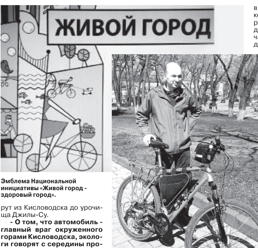
Эмблема Национальной инициативы «Живой город — здоровый город».

А хорошо тренированные велосипедисты умудряются за один день спускаться в долину Нарзанов или на гору Бермамыт и вернуться в город. Для тех же, кто любит путешествовать с ночевками в палатке, отлично подойдет марш-