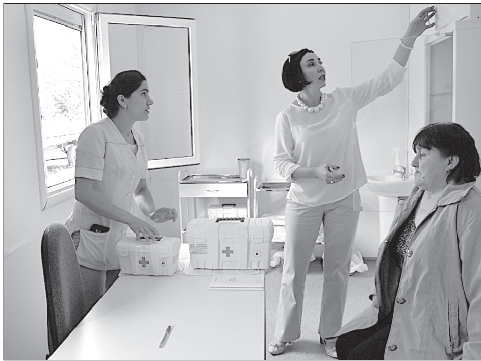
Одно из помещений фельдшерско-акушерского пункта в хуторе Верхний Калаус Андропо-вского района сразу после его открытия в мае прошлого года.

- У нас реализуется региональный проект «Обеспечение медицинских организаций государственной системы здравоохранения Ставропольского края квалифи-