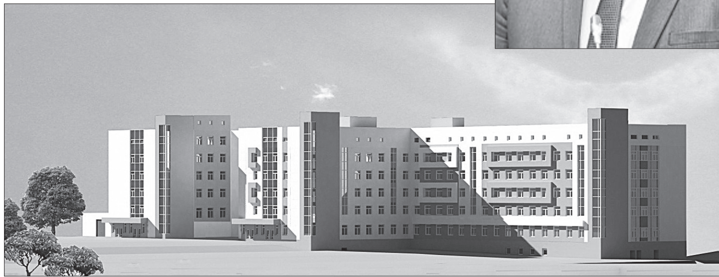
Проект нового корпуса на 280 коек ГБУЗ СК «Краевая детская клиническая больница». Завершить строительство планируется в 2021 году.