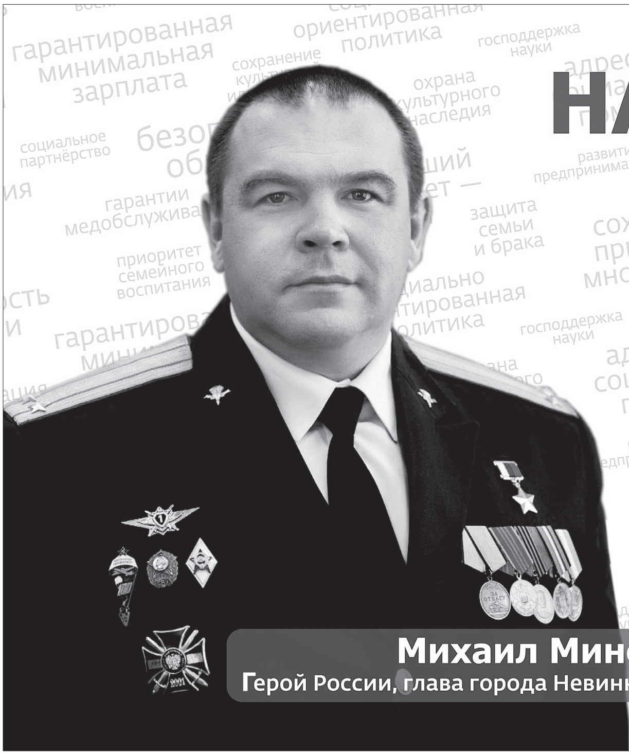
Михаил Миненков Герой России, глава города Невинномысска