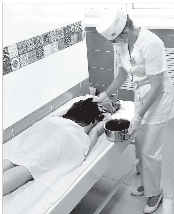
Аппликации из тамбуканской грязи помогают от многих суставных заболеваний.