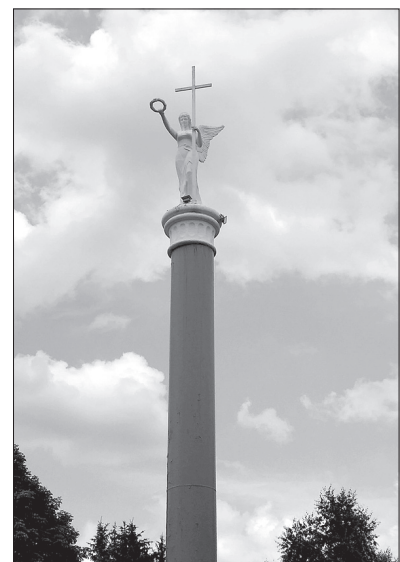
Символ санатория «Виктория» - богиня победы на высоченной колонне.

Чтобы убедиться в последнем, мы направимся в одну из трех столовых санатория. Дверь в обеденный зал открывает портье в пер-