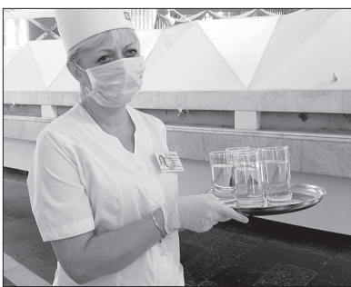
Медсестра в галерее минеральных вод предлагает нам «Ессентуки-4».

Сейчас же гости из Башкортостана направляются в галерею минеральных источников санатория «Виктория» - легендарное «пятитысячнику». Радиозонное круглое здание со множеством питьевых бюветов рассчитано на пять тысяч посетителей в день. Однако сейчас, согласно распоряжению Роспотребнадзора, там нет никого, за исключением трех медсестер в одноразовых масках и перчатках. Они у входа встречают посетителей,