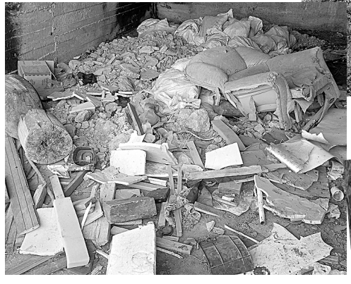
Вот такие кучи мусора вываливают из машин там, где украли секции решетчатого забора.