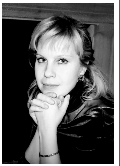
Твои друзья и коллеги.