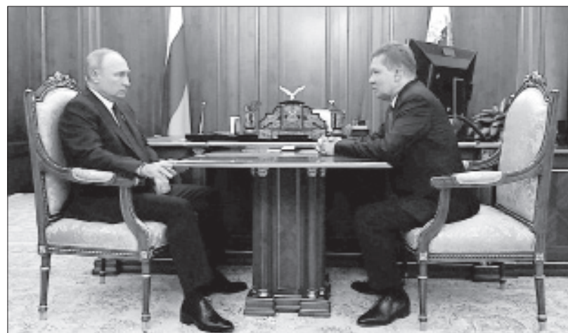
Владимир Путин и Алексей Миллер во время рабочей встречи в сентябре 2020 года.

Существующий порядок взаимодействия с регионами разграничивает зоны ответственности участников следующего образом. Администрации субъектов РФ, на основании планов социально-экономического развития, формируют предложения по строительству объектов газоснабжения. С учетом этого «Газпром» формирует пятилетние программы развития газоснабжения и газификации, которые подписываются сторонами. Компания за счет собственных средств обеспечивает строительство газопроводов-отводов, газораспределительных станций и межпоселковых газопроводов до границ населенных пунктов. В настоящее время «Газпром» совместно с руководством регионов завершает работу по подготовке программ на очередной пятилетний период - 2021 - 2025 годы. До конца текущего года будет утверждено 67 таких документов.