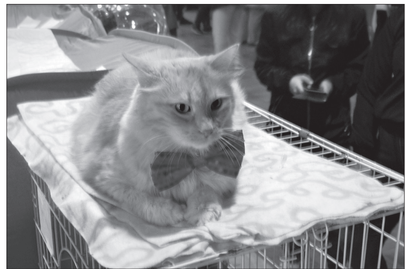
Кот Борис - звезда Интернета.

ми, дергают питомца за лапки, хвостик и другие места. В выставочном домике для животных окна из плотного целлофана, и если вы захотите сфотографировать понравившегося вам конкурсанта, сделать это не