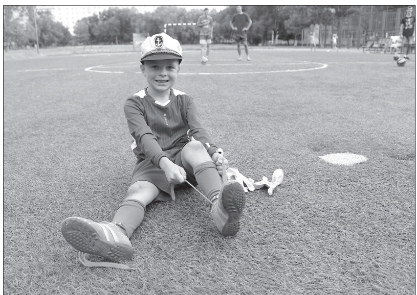
За последние три года в Невинномысске в рамках реализации программы поддержки местных инициатив в строй ввели семь многофункциональных спортплощадок.

Общая сумма средств, затраченных на реализацию проектов по обустройству трех спортпло-