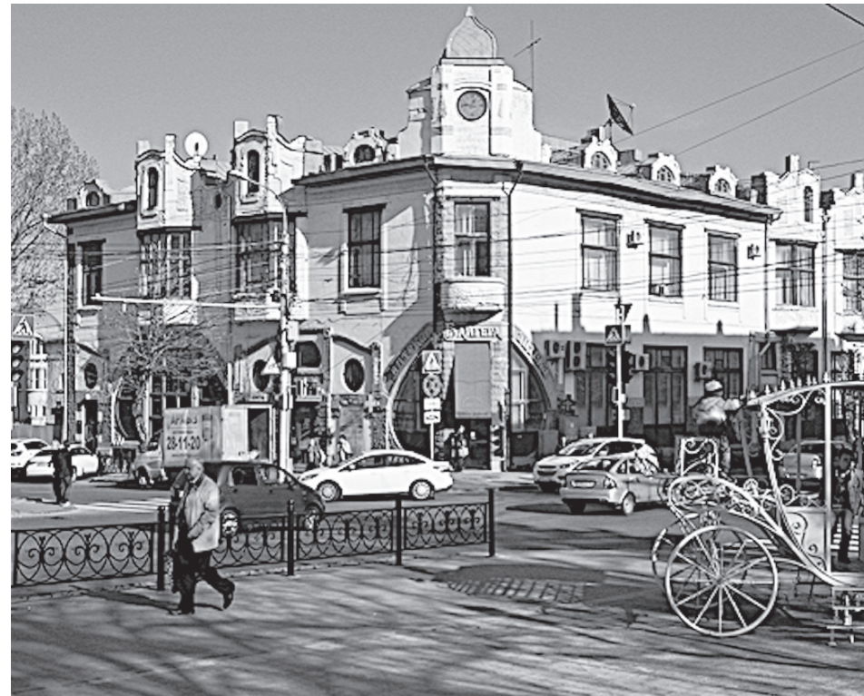
«Аптека Байгера» в Ставрополе – яркий пример того, как надо содержать объекты историко-культурного наследия.

влечет применение мер административной или даже уголовной ответственности.