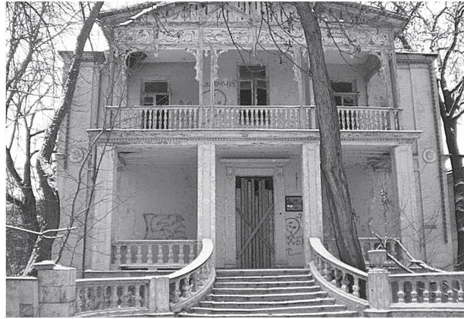
Здание дачи «Елочка» в Ессентуках пустует с 2014 года и постепенно разрушается. По решению суда нынешний собственник объекта обязан провести здесь ремонтно-реставрационные работы.

- Совершенно верно, так было в прошлом году на Грушевском городище в Ставрополе при строительстве дороги. А недавно в районе Новотроицкого водохранилища, где были организованы полевые спасательные работы в отношении целой курганной группы. Мы стараемся донести до собственников, что, проводя те или иные земельные работы, они могут нарушить ценный культурный слой, а причинение вреда культурному наследию, в том числе и объекту археологии,