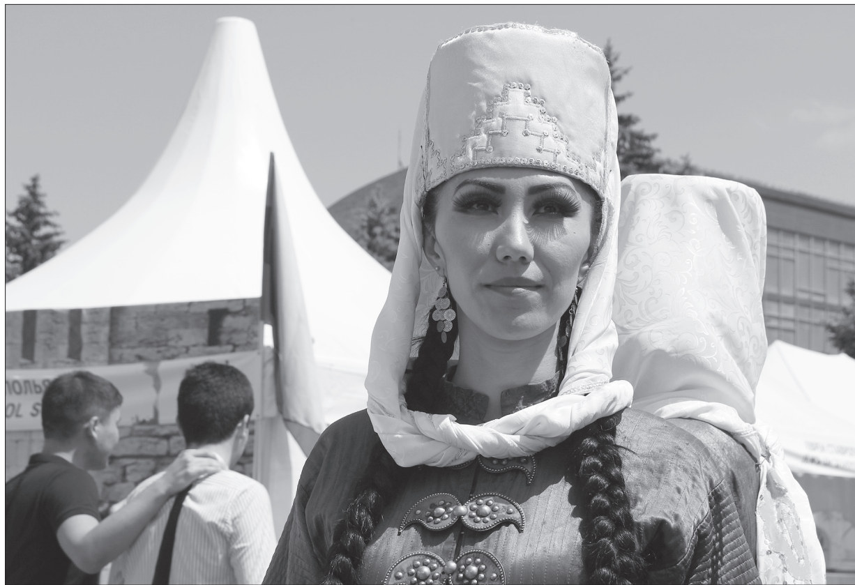
Ногайцы на выставке национальных подворий в Ставрополе в 2019 году.

Крепкая семья – ценность для всех без исключения кавказских народов, в том числе и ногайцев. Издавна семейная жизнь и отношения регулировались адатами – традиционными обычаями. В том или ином виде они сохраняются до сих пор.