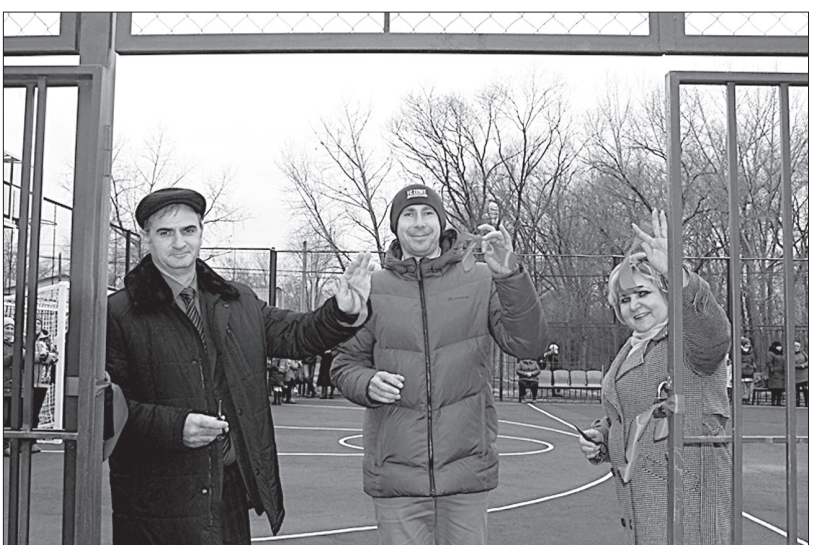
В селе Октябрьском Ипатовского городского округа появилась многофункциональная спортивно-игровая площадка с зоной уличных тренажеров и воркаута, строительством которой осуществилось благодаря краевой программе поддержки местных инициатив.

Свадьбы будут веселее и дешевле В Советском городском округе одним из объектов, включенных в краевую программу местных инициатив, стал зал торжеств МКУ «Культурно-досуговый центр» в селе Правокумском, где приступили к ремонту здания. Почти 20 лет здесь не было пункта общественного питания - кафе или столовой. Для проведения различных мероприятий