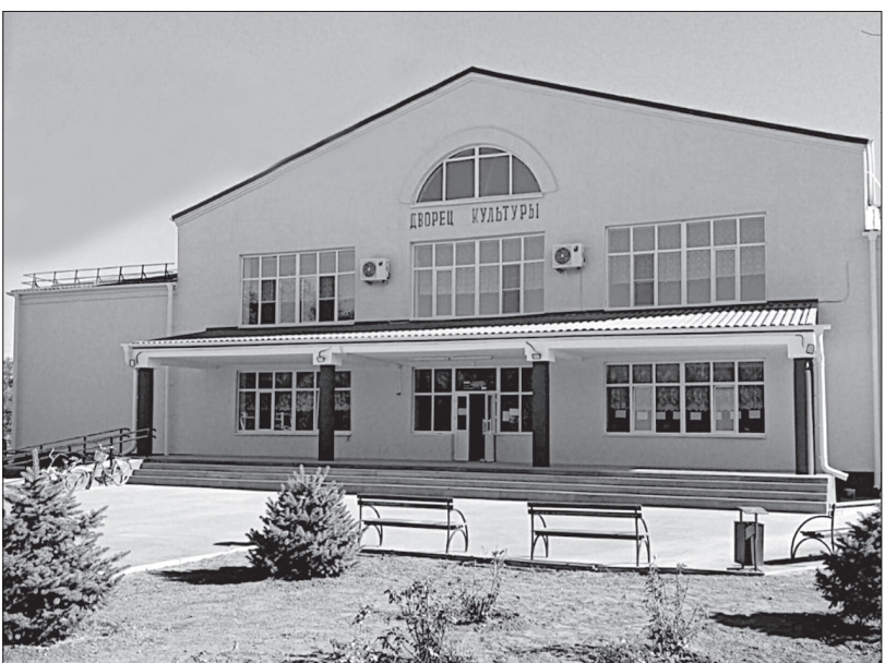
Дом культуры села Алексеевского в Изобильненском округе после ремонта.