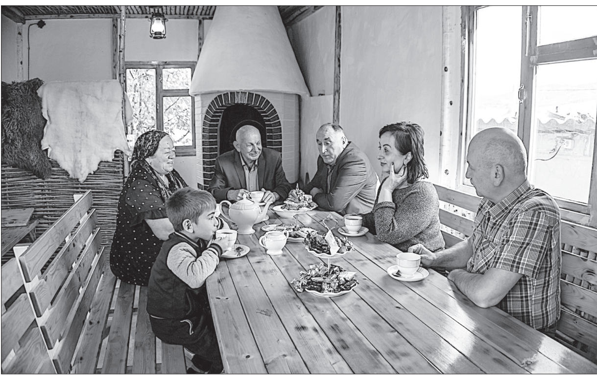
Съемки документального фильма «Абазыны на Ставрополье».

- А кто судит? Кто анализирует состояние межнациональных отношений в крае? Сами работники комитета? Ни в коем случае. Чтобы оценки были объективными, их должны