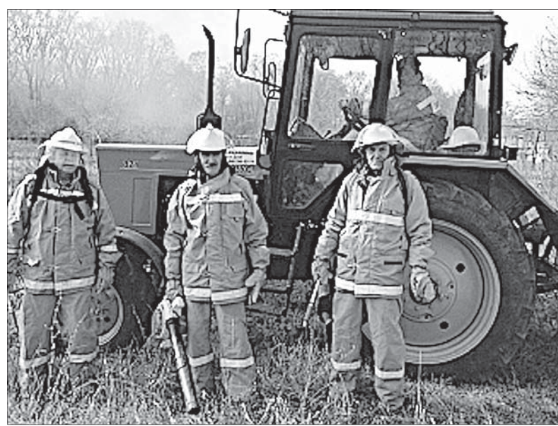
Работники подведомственного министерству природных ресурсов и охраны окружающей среды Ставропольского края ГБУ «Калаусский лесхоз» обеспечивают охрану, защиту, воспроизводство лесов на общей площади более 6,5 тысячи гектаров, в том числе на территории Александровского, Новоселицкого и Благодарненского округов.

Охрана и приумножение зеленого богатства региона - одно из основных направлений подпрограммы «Развитие лесного хозяйства» государственной программы Ставропольского края «Охрана окружающей среды». Эту миссию выполняют десять государственных лесхозов, на содержание которых из бюджета края ежегодно направляется более 34 миллионов рублей. К примеру, подведомственное министерству природных ресурсов и охраны окружающей среды Ставропольского края учреждение «Калаусский лесхоз» обеспечивает охрану, защиту, воспроизводство лесов об-