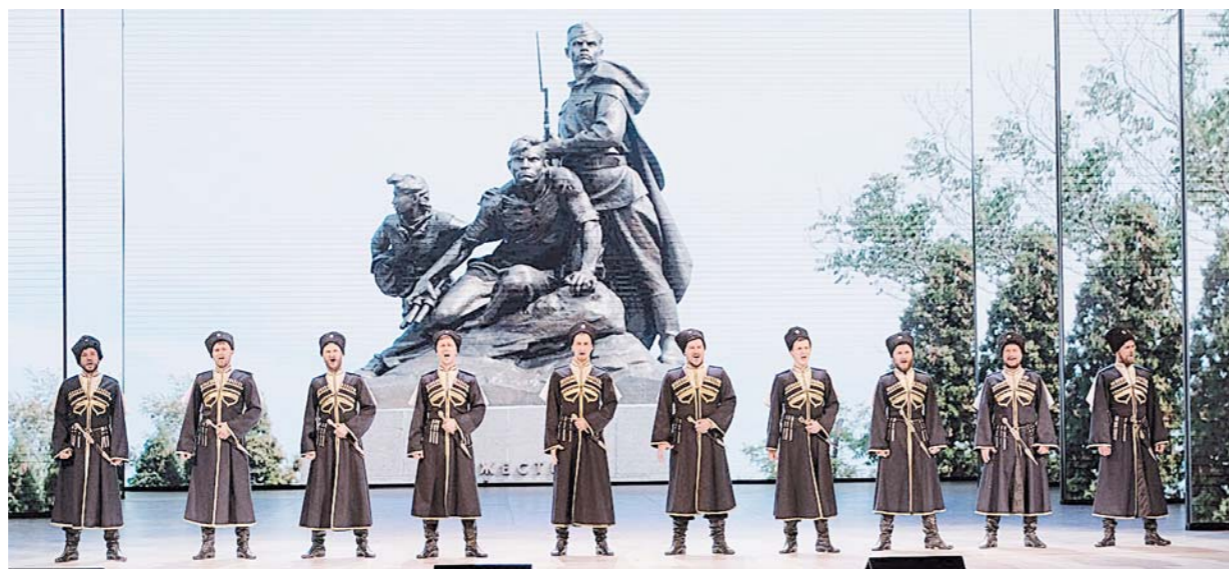
Открытие фестиваля «Крымская весна» во Дворце культуры и спорта Ставрополя.

В жизнь современной России прочно вошло поэтическое название «Крымская весна»: семь лет назад вернулся в родную гавань славный Крымский полуостров, восстановив историческую прочную связь с Родиной.