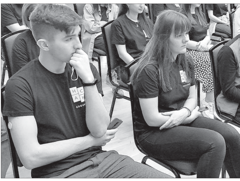
Студенты вузов из всех субъектов СКФО внимательно слушают спикера.

предложили участникам хакатона и профильные мастер-классы от опытных специалистов в сфере туризма и IT-технологий.