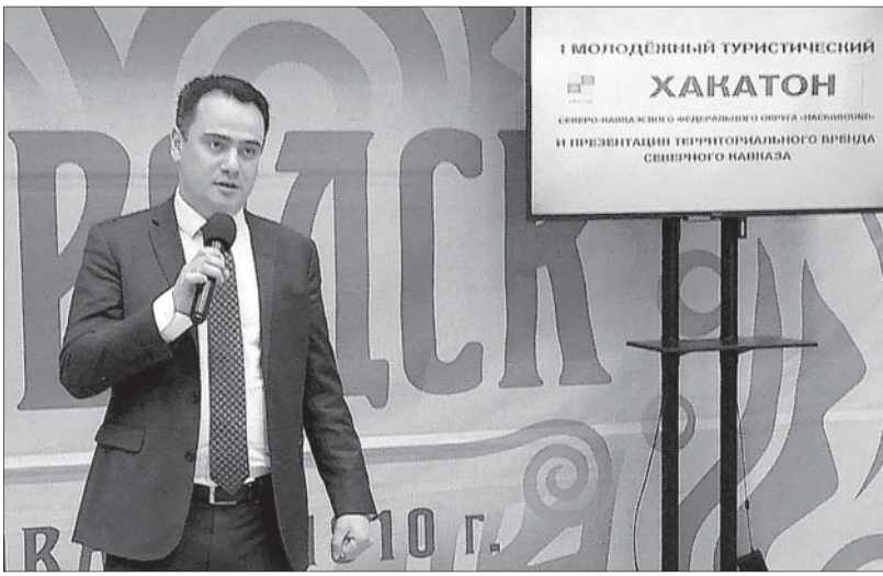
Участников хакатона приветствует помощник полномочного представителя Президента РФ в СКФО Сергей Стариков.