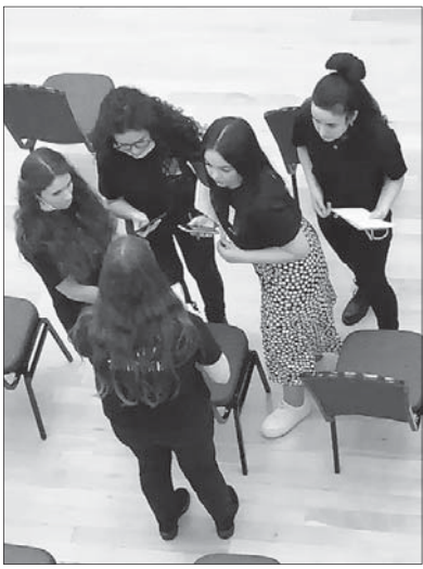
Одна из команд, участвующих в хакатоне, обсуждает полученное задание.