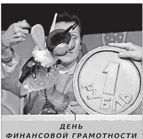
ДЕНЬ ФИНАНСОВОЙ ГРАМОТНОСТИ

В рамках пилотного проекта, организованного в сотрудничестве с краевым министерством финансов, в Театре кукол будут ежемесячно проходить дни финансовой грамотности для детей дошкольного и младшего школьного возраста. Первыми участниками мероприятия станут юные зрители, пришедшие в воскресенье на спектакль «Дюймовочка». На игровых площадках перед представлениями актеры займут детей развивающими играми, и малыши смогут усвоить полезную информацию