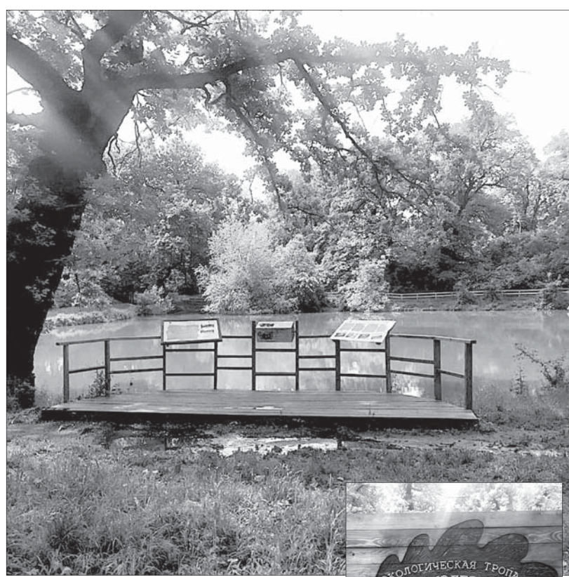
«Эммануэлевское урочище», что в краевом центре, самая молодая особо охраняемая природная территория Ставропольского края, которой скоро исполнится пять лет. Этот дивный уголок природы достался краевой столице в наследство от генерал-губернатора Кавказской области Георгия Эммануэля. Зеленый массив с живописным прудом и разнообразной фауной, представленной 37 видами птиц, с давних пор был любимым местом отдыха жителей и многих знаменитых гостей города. Больше года назад здесь была создана экологическая тропа для занятий школьников и досуга ставропольцев.

Как охраняются такие территории, что делается в крае для того, чтобы максимально сберечь