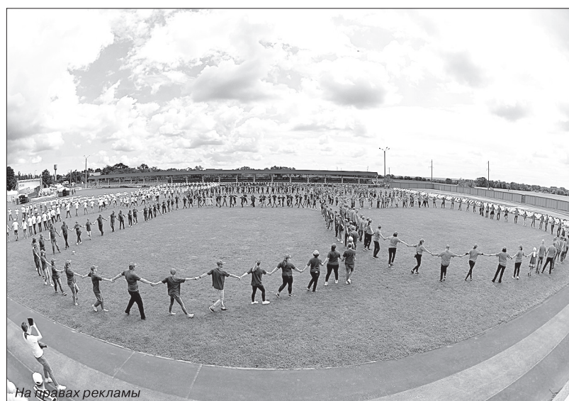
На фото: реклама

Работники «Газпром трансгаз Ставрополь» ярко и масштабно отметили День России.