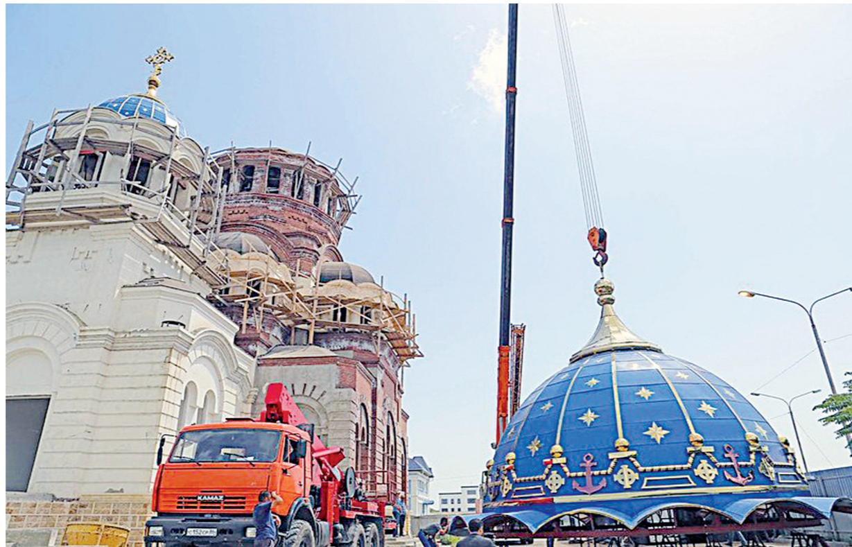
Н. БЫКОВА.