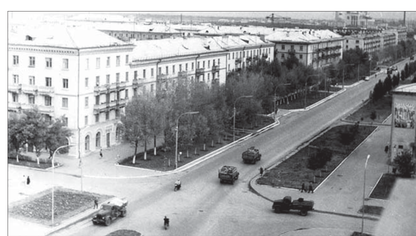
Невинномысске в 1960-е годы.

знавались позже многие водители, к дисциплине их приучил вожделый, корректный и в то же время принципиальный инспектор. Не могли они раз достану свою тетрадку, укажу на твою фамилию и, уж извини, отвечать будешь по полной. Как при-