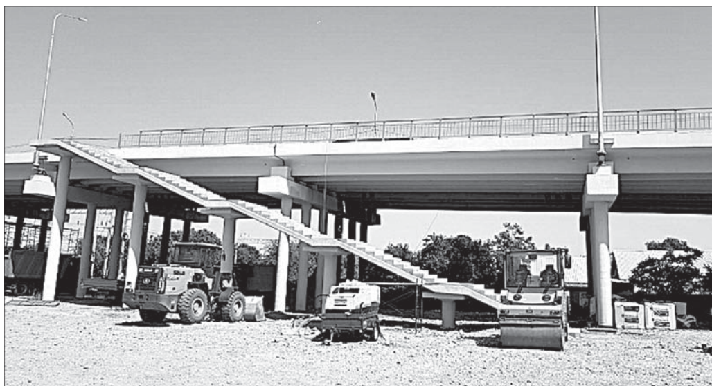
Ремонт путепровода в Минеральных Водах.

- Региональным проектом «Дорожная сеть» к 2024 году предполагается увеличить долю автомобильных дорог регионального или межмуниципального значения, соответствующих