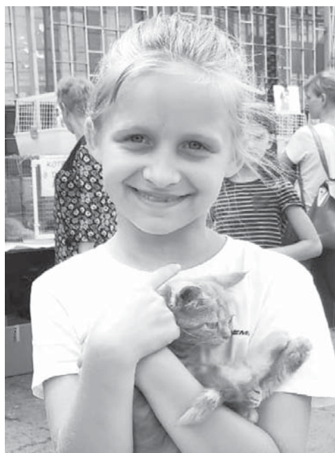
Л. ОГАНЕСИ.

Напомним, по условиям программы ОСБВ собак отлавливают по графику, а также по заявкам жителей, обрабатывают от паразитов, вакцинируют от бешенства, стерилизуют, прикрепляют бирки и возвращают обратно в среду обитания. После обработки собаки безопасны и здоровы. Повторному отлову животные не подлежат - только если они проявляют немотивированную агрессию в отношении человека.