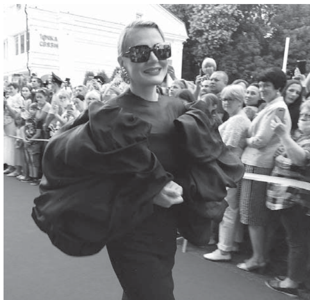
На красной дорожке заслуженная артистка России, кинорежиссер, сценарист Рената Литвинова.

Ее сменила 300-метровая – официально в честь 300-летия Россий-