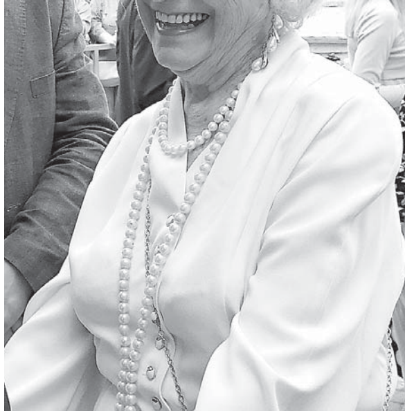
И в 93 года народная артистка России Татьяна Пилецкая в отличной форме.

ской империи. Заодно усилили меры безопасности в пунктах пропуска зрителей: к привычным металлоискателям прибавили проверку на отсутствие температуры и наличие прививок от ковида.