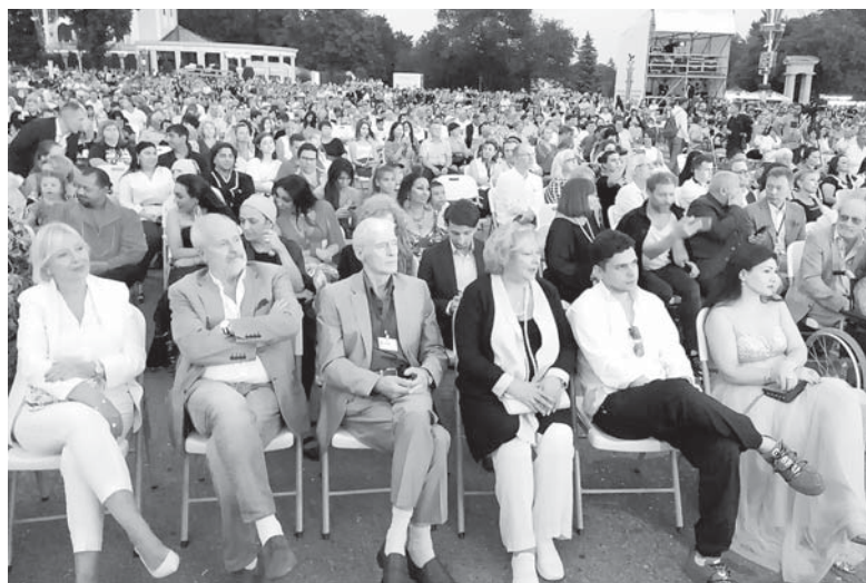
На Театральной площади Ессентуков аншла.

В минувшую субботу в городкурорте Ессентуки торжественно открыли Четвертый фестиваль популярных киножанров «Хрустальный Источникъ».